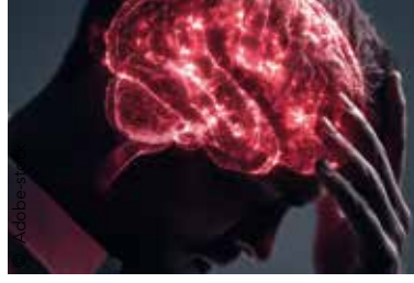
■ ■ ■ DGFIP Crise des suicides