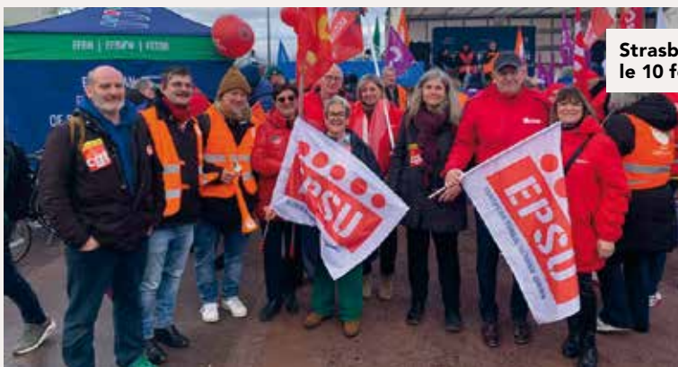
Strasbourg, le 10 février