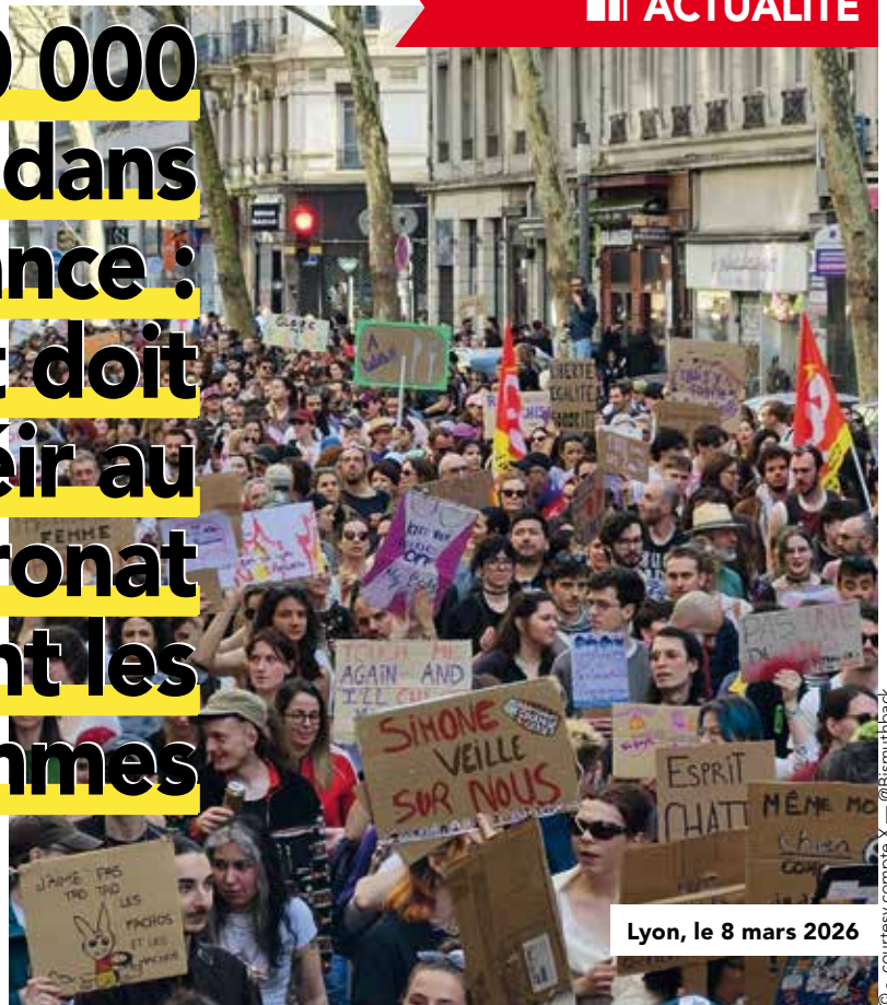
Lyon, le 8 mars 2026

La CGT s'est félicitée de la réussite du week-end du 8 mars de lutte pour les droits des femmes.